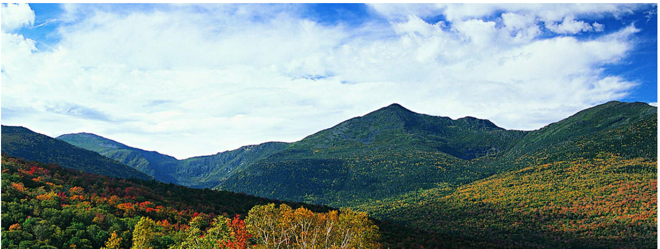
La forêt des Appalaches

Ce livre donne envie de continuer dès la première page et est également stressant à lire mais on peut rapidement se mettre vraiment dans la peau de Trisha qui n'a vraiment pas de chance. Les gens qui aiment les romans d'horreur vont forcément aimer ce livre.