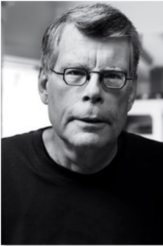
Portrait de Stephen Edwin King